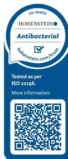
Voorbeeld: Certificaat voor Eurodekor

Onze producten worden geproduceerd zonder toevoeging van antibacteriële additieven en worden getest volgens de internationaal erkende testmethode (ISO 22196 = JIS Z 2801) voor de evaluatie van antibacteriële activiteit. Bovendien zijn onze producten gecertificeerd door het onafhankelijke, externe Hohenstein Institute .